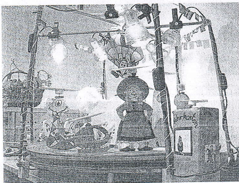
Mit diesem solarbetriebenen Karussell beteiligte sich die Betreuungsgruppe aus Mornshausen am Solarwettbewerb.